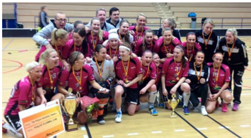
Malmö FBC tog hem Skånemästerskapen på damsidan efter att ha slagit SödraDal med 7-2 i finalen.

Organisationens resultat och ställning i övrigt framgår av efterföljande resultat- och balansräkning med tilläggsupplysningar. Alla belopp uttrycks i svenska kronor där annat anges.