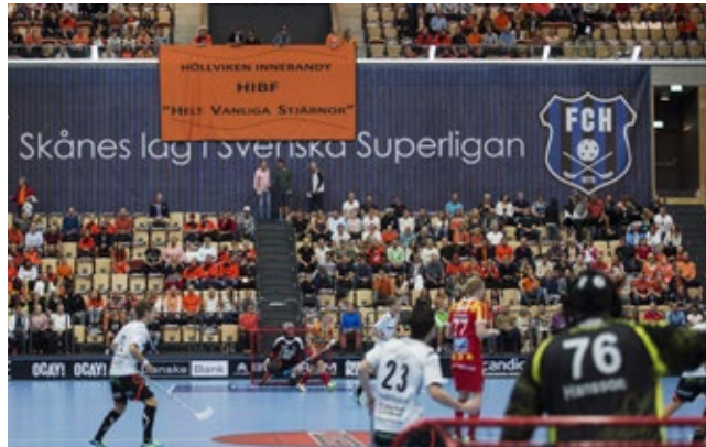
Den 18 september spelades ett historiskt Skånederby mellan två skånska lag i herrarnas SSL inför nästan 4 000 åskådare i Helsingborg Arena.