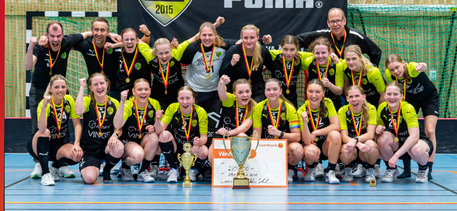
IBK Lund tog hem segern i Skånemästerskapen dam säsongen 22/23.