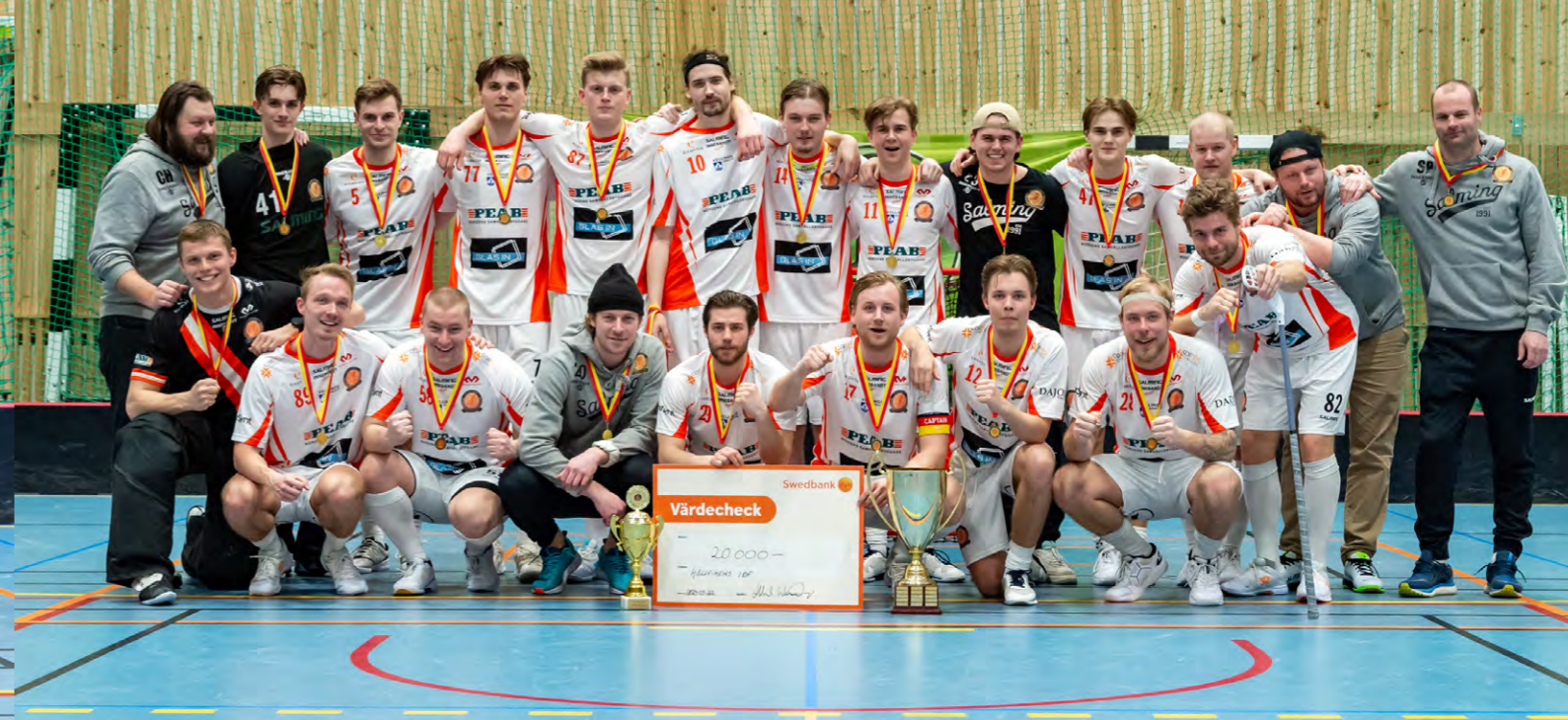
Höllvikens IBF tog hem segern i Skånemästerskapen herr säsongen 22/23.